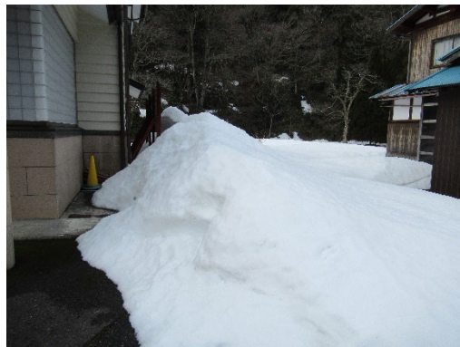
< 中河内診療所 >