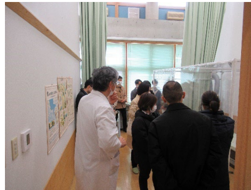
< 中之郷診療所 >