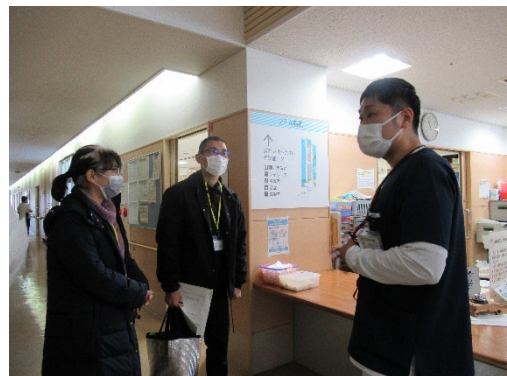
< 湖北病院 >