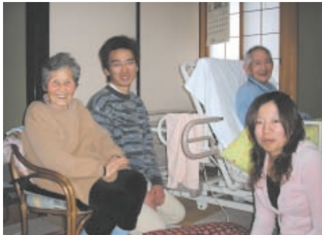
医学生が患者さんの自宅を訪問する6年間一貫患者訪問実習

た。この研究は、医学生と模擬患者との医療面接面の録画の分析に基づいて、言語以外のコミュニケーションが、模擬患者による医療面接の評価にどう影響するのか検討したものです。