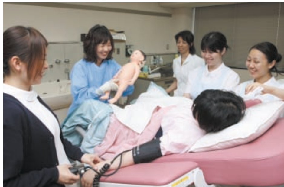
4年生の実習前の演習には3年生も参加する