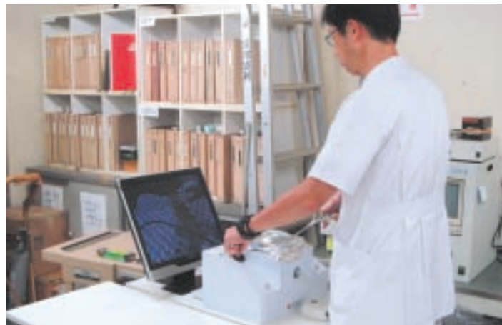
ドライボックスを使った訓練風景

前立腺は男性だけにある生殖器官で、膀胱のすぐ下にあつて尿道を取り囲んでいます。前立腺がんはアメリカでは男性にもっとも多いが、近年、日本でも急増しています。高齢化が進んだことや食生活の欧米化のほか、検査の普及で早期に見え始めるケースが増えていることも一因です。 主な治療法に手術、放射線治療、ホルモン療法があり、がんの進行度や年齢などを考慮して治療法を選択します。手術の対象になるのは、限局がん（がんが前立腺内部にとどまっている）で、一般に手術に耐える体力のある75歳以下の患者さんです。 腹腔鏡による前立腺がん手術の歴史は浅く、日本では2006年に保険適応になったばかりですが、その技術の進歩には目をみはるものがあります。