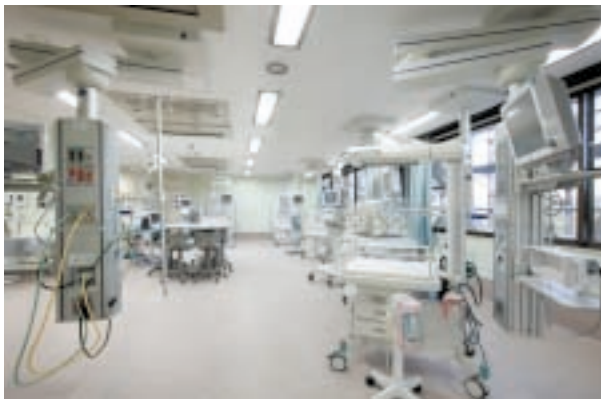
増床された NICU (新生児集中治療室)

です。現実には産婦人科の中でも専門領域は特化してきていますので、すべてを一人で行うことはなくなりつつありますが、少なくとも産婦人科全般の知識に通じており、患者さんの一生のアドバイザーたるというのが真に求められている理想像でしょう。