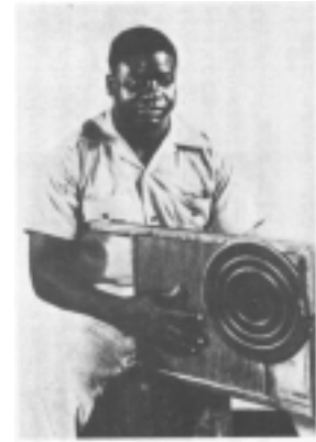
図6 ウォッシュボードを持つミュージシャン(『歴史』p.208)