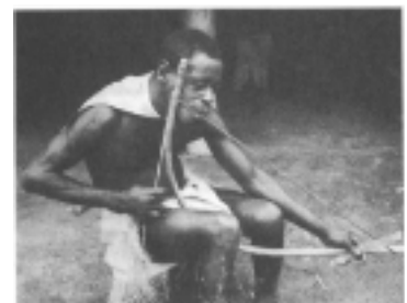
図7（『アフリカの音の世界』p.76より）

(34) リュート系楽器と楽弓について。楽弓とは、狩猟用の弓のつるの部分をはじいたり棒で叩いたりして音楽を奏でる、最も原初的な弦楽器のことである。この楽弓はサハラ砂漠より南のアフリカ大陸には至る所で見られる。カラハリ砂漠などに住むサン（かつて「ブッシュマン」と呼ばれていた人々）などは実際に狩猟で使った弓をそのまま音楽にも使っている。ただ問題は、その音が大変に弱いことだった。そこで人間の知恵は口腔を共鳴器として利用し、音を増幅することを思いついた。その他ひょうたんや果てはブリキ缶などを共鳴器にしたものもある。この楽弓に何本も弦を平行に取り付ければ、たちまち弓形ハープになる。さらにいくつもの楽弓を一本の棹にまとめて共鳴器をつければ、ギターやヴァイオリンなどに通じるリュート系の楽器になる。弓で引くのをフィドルと分類する。『アフリカの音の世界』、皆川達夫『楽器』（マール社、1992年）を参照。