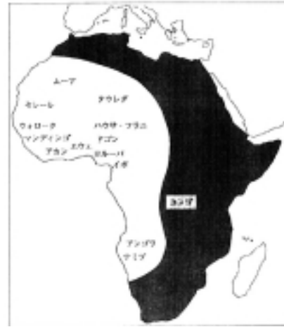
図1 『ニグロ・スピリチュアル』p.47より