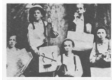
図4 子供たちの自作楽器によるバンド (『歴史』p.89)

彼らは ジャグ 水差し、 ウォッシュボード 洗濯板、自作のギター、ウォッシュタブ・ベースなどをなんでも楽器として使った。面白いのは、これらの自作の楽器に、アフリカの伝統楽器との類似点が多