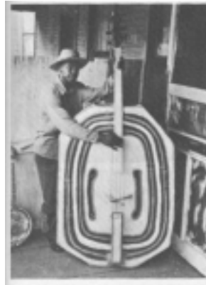
図5 自作ベースを前にするミュージシャン(『歴史』p.92)

豊かな文化に接してきた人間が一転して、赤線の酒場の流しなどをしなくてはならない状況が生まれた。これがラグタイム誕生の直接の原因であると思われる。スコット・ジョプリンもジェリー・ルー・モートンも、クラシックの訓練を受けた楽士だった。彼らにしても、後に歓楽街でピアニストとなるのである。ニューオーリンズが黒人音楽を語る上で重要な位置を占めるのは、このあたりの事情による。彼らは黒人音楽に、より洗練された西洋音楽的要素を新たに与えたのである。ジュークボックスが普及する前の芸能の主役はピアノであった (36) が、ニューオーリンズの歓楽街には、南部諸州を渡り歩くピアニストたちが集