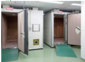
脳波検査ユニット