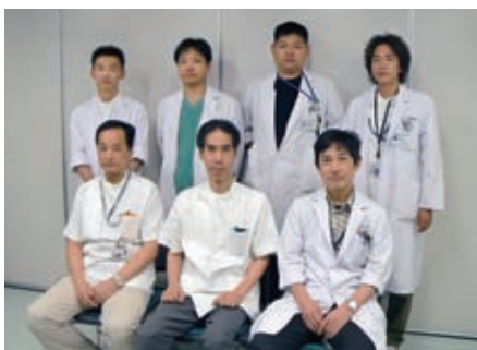
脳神経外科スタッフ