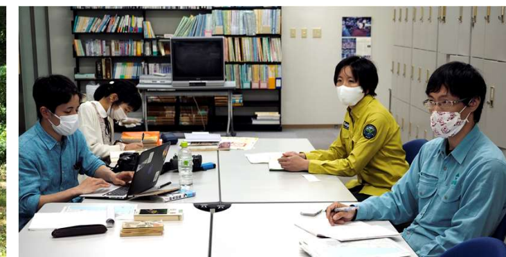
環境省の方々に相談し、 市民に役立つマップづくりを目指す