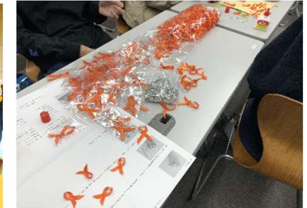
学生たちの手作りによるオレンジリボン