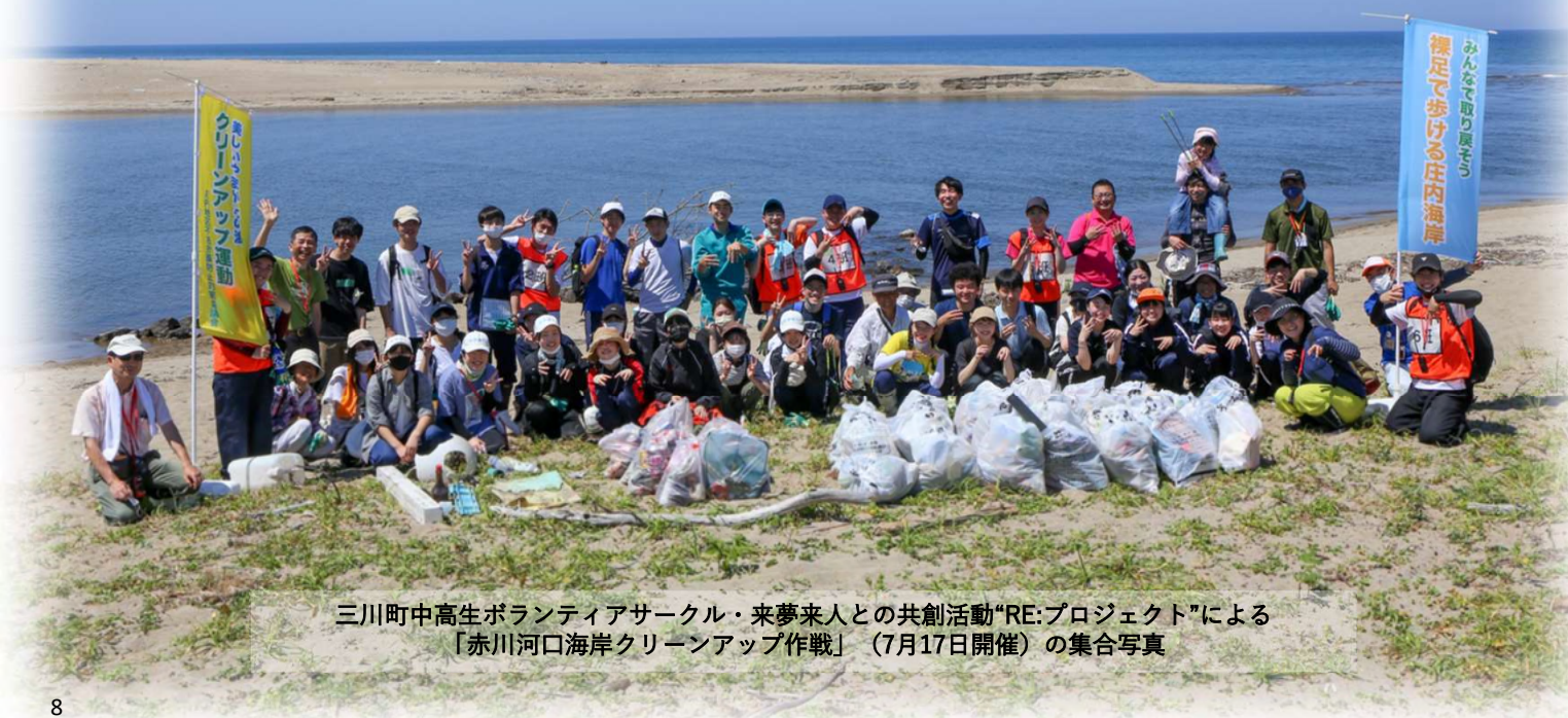
三川町中高生ボランティアサークル・来夢来人との共創活動「RE:プロジェクト」による「赤川河口海岸クリーンアップ作戦」(7月17日開催)の集合写真

センターでは、今後も地域の多様な主体、講義・演習や学生独自の活動を柔軟につなげ、庄内の若者から全国・海外に発信する活動に積極的に取り組んでいきますので、皆様にもぜひこの共創の輪に加わっていただきたいと願っています。