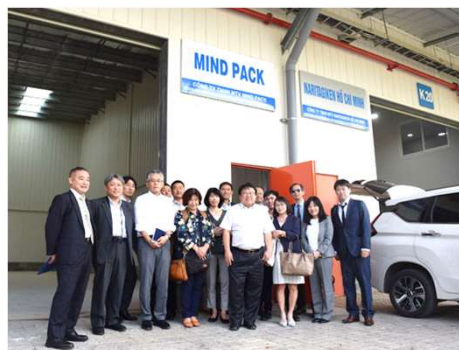
視察ツアーでの集合写真 （ロンアン省 KIZUNA レンタル工場）