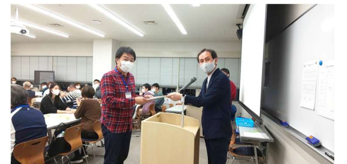
2日間にわたる講習を終えて、修了証の授与が行われました。