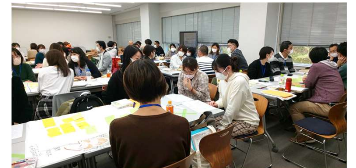
2日目には、社会福祉士を目指す本学の学生も一緒になって、白熱したロールプレイングに参加しました。