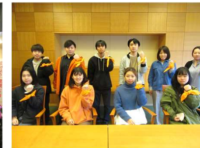
オレンジリボンチーム2021のメンバーです。