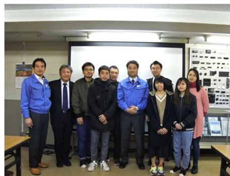
エムデン無線工業への工場見学 （神奈川県藤沢市）