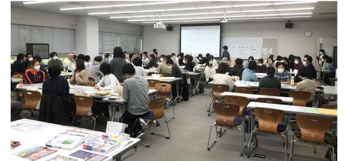
山形県内の58名の社会福祉士の方が受講された会場の様子