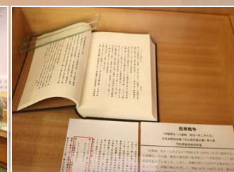
門松先生所蔵の貴重な資料等