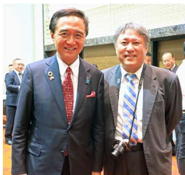
ハノイで開催された経済交流会 での神奈川県黒岩知事との写真 （2019年11月）