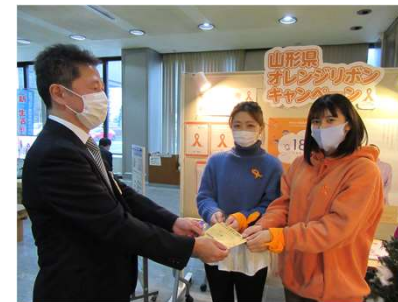
山形県庁へオレンジリボンを配布しました。